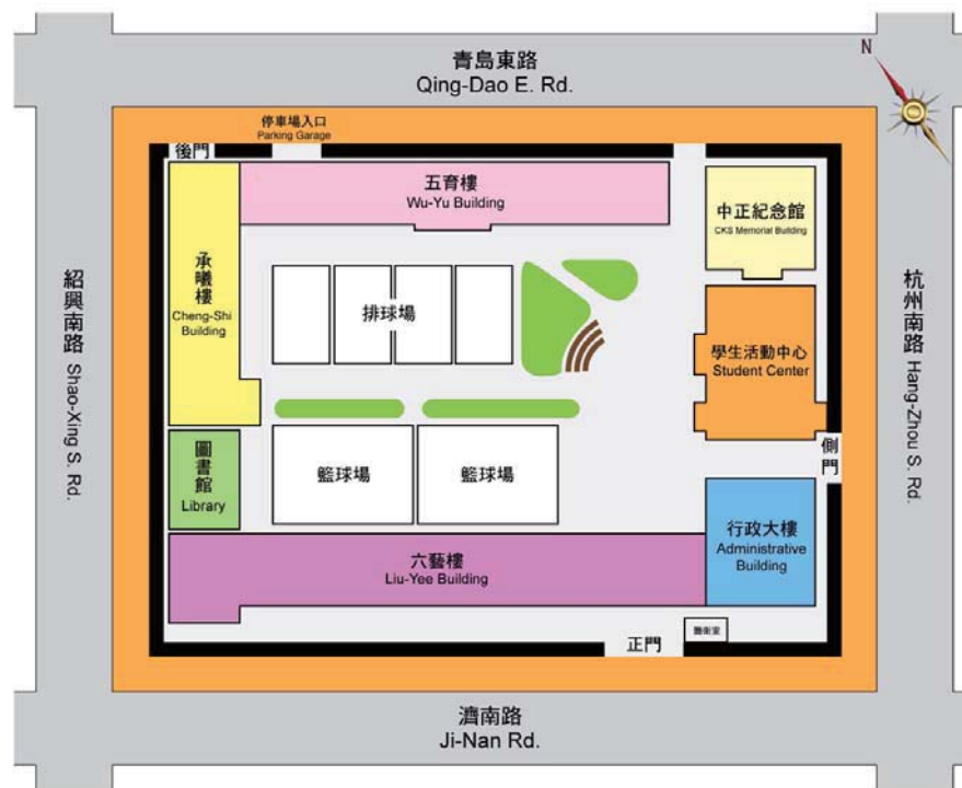
國立臺北商業技術學院位置及交通路線圖

本校校址為 台北市中正區濟南路一段 321 號 ，搭乘大眾運輸工具（公車、火車、捷運或客運）或是自行開車皆可抵達，搭乘方式請參考後方所述。